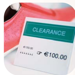
Étiquettes de prix

La P-touch 2460 dispose d'une série de fonctions d'impression parmi lesquelles l'impression bi-directionnelle, verticale, drapeau, miroir, l'impression pour panneau et