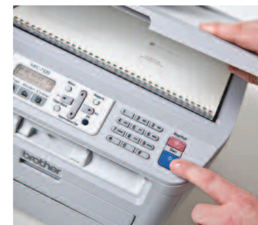
Faxer, copier ou numériser vos documents reliés.