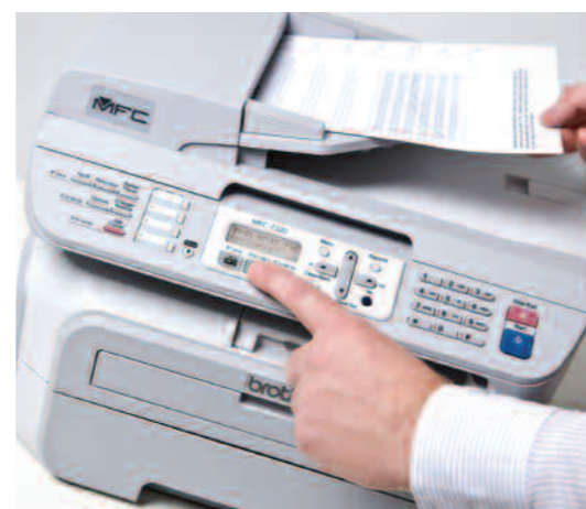
Chargeur automatique de documents idéal pour faxer, copier ou numériser plusieurs pages d'un document.

Plus qu'une imprimante, le MFC-7320 est doté de multiples fonctionnalités telles que l'impression, le fax, la copie et la numérisation qui vous apporteront un réel bénéfice pour votre entreprise.