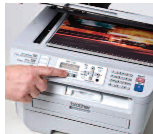
Numérisation monochrome ou couleur haute qualité.